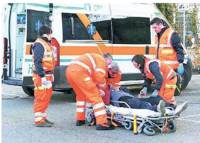
Il personale del 118 soccorre l'uomo nel parcheggio dell'ex Mof