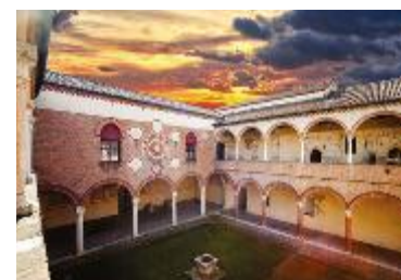
CASA ROMEI A FERRARA

FERRARA - 22 SETTEMBRE, dalle ore 18,30 Casa Romei, Via Savonarola 30, Ferrara RIEVOCAZIONE STORICA NEL CORTILE D'ONORE a cura dell'Ente Palio