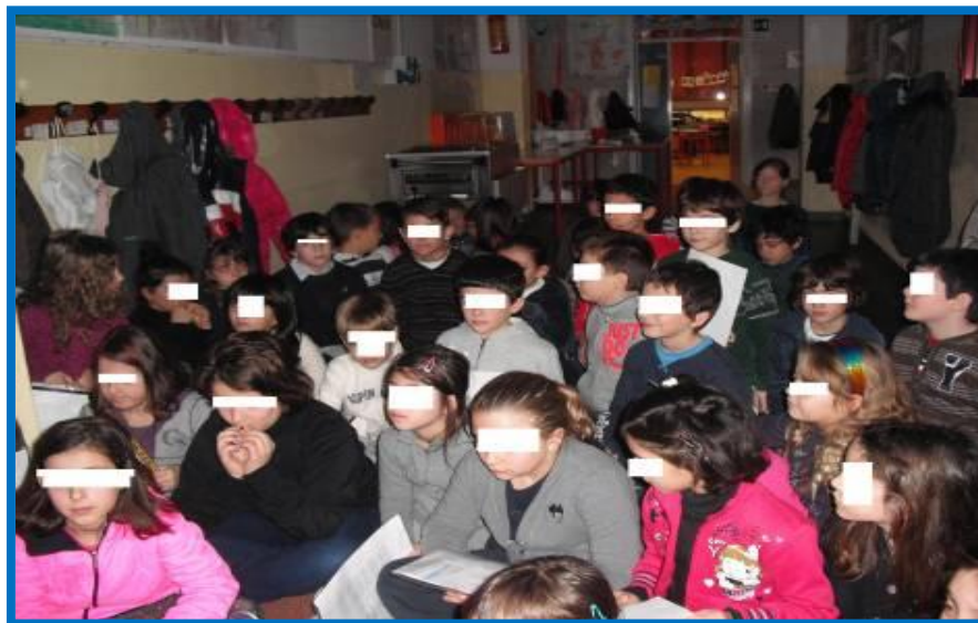
Un minuto di silenzio