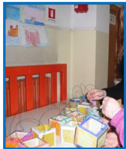
Illuminiamo il paese della guerra con le lanterne del paese della pace