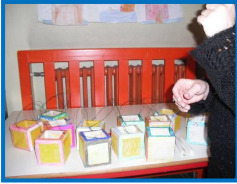
Ecco le nostre lanterne