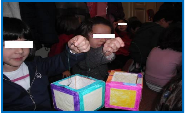
Che belle tutte illuminate!!