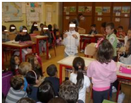
L'albero di benvenuto: gli alunni delle classi terze accolgono i bambini di classe prima.