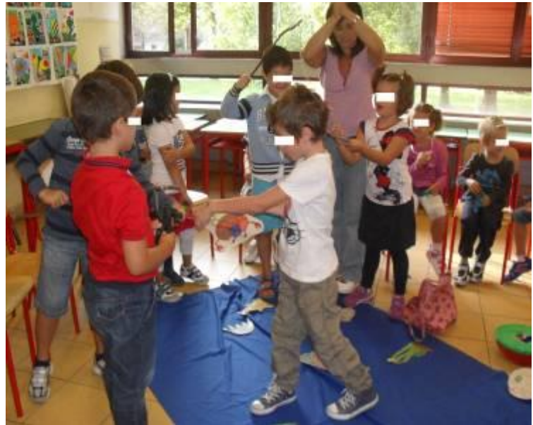
Giociamo a prendere i pesci