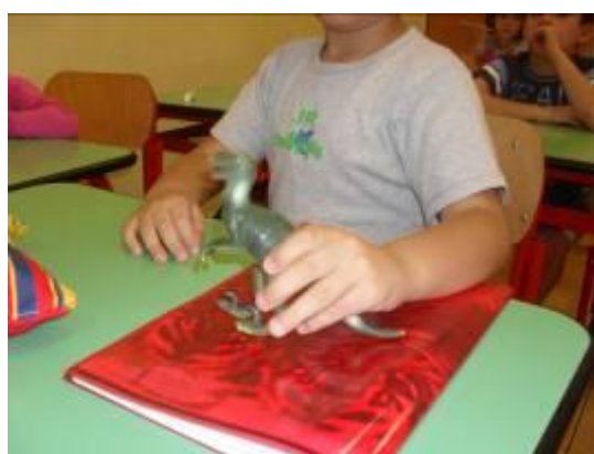
E i suoi amici...