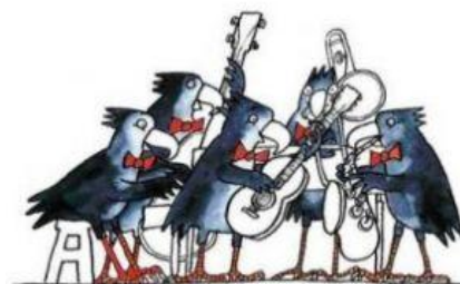
Indirizzo Musicale Scuola Secondaria 1° M. M. Boiardo