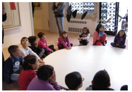
ARCO DI PETALI di Alexander CALDER 1941