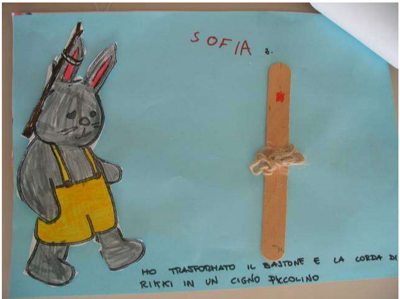
Scheda didattica di verifica dopo le attività realizzate nel laboratorio dei legnetti