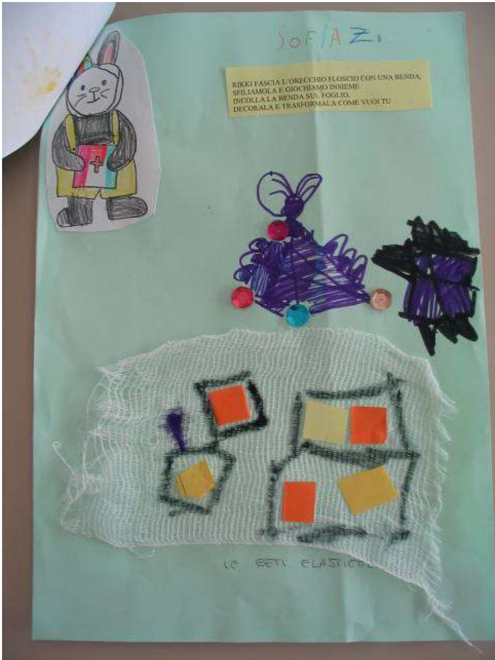
Scheda didattica a collage