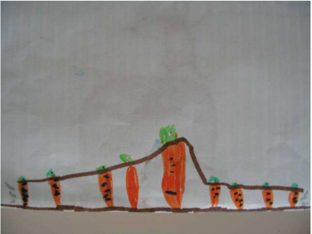
Disegno libero che illustra le attività del laboratorio senso-percettivo con le carote