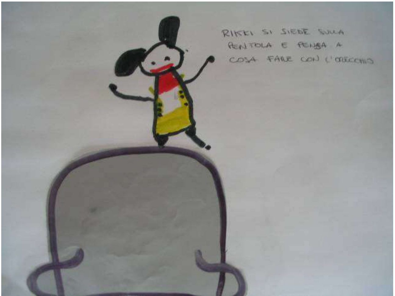
Scheda didattica a collage