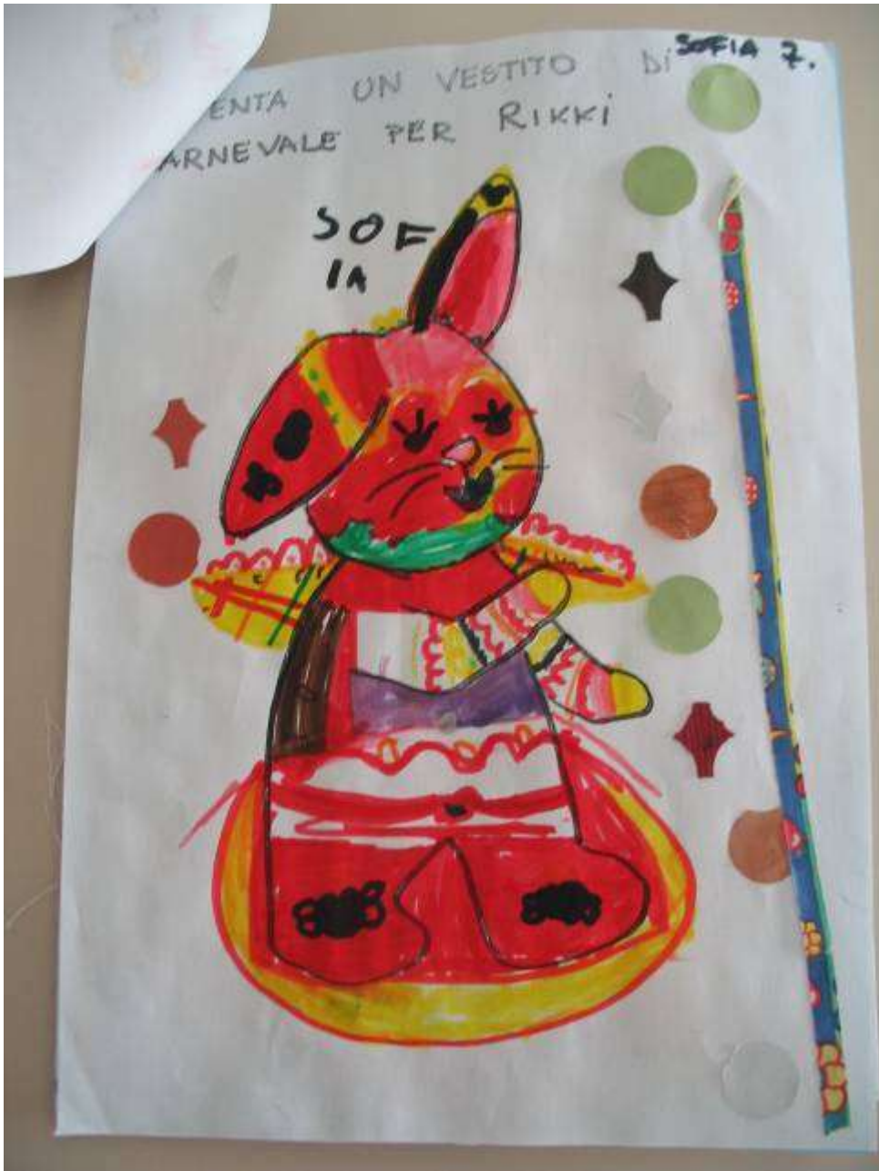
E anche Rikki festeggia il Carnevale !