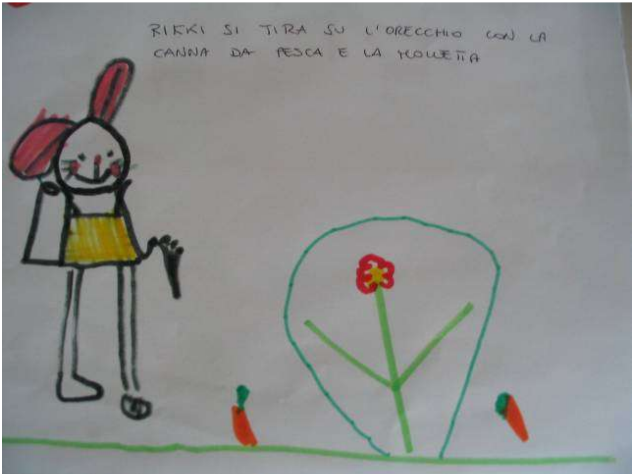
Un disegno libero che rappresenta il racconto