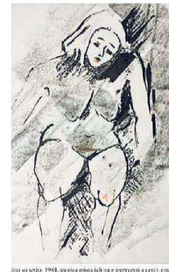
Linea su sedia, 1984, tecnica mista (china e interventi a cera), cm.

Nata a Mirabello, la Guidetti è artista delicata e donna di temperamento, dotata di un carattere e di una volontà unici negli anni ha appassionato il suo pubblico grazie a un talento tutto femminile in-