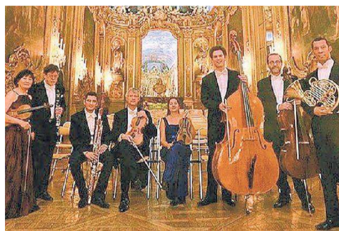
L'ensemble Octuor de France che sarà domani a Ferrara

Con l'Octuor de France omaggio di Ferrara al mito del muto e al primo divo animato L'ensemble accompagnerà dal vivo le proiezioni del film "College" e di due cartoni