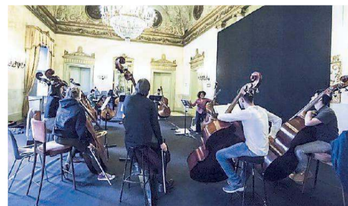
Un momento delle prove della Euyo