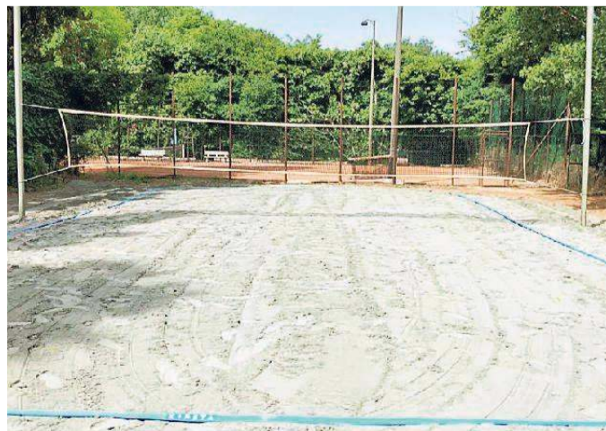
Il campo di beach volley, che da quest'anno è aperto al pubblico

per il rimessaggio delle imbarcazioni, organizza lezioni di canoa e di canottaggio.