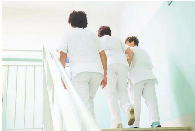
Nuove regole di comportamento per i dipendenti dell'Asl

Il nuovo Codice è stato approvato pochi giorni fa e fissa i paletti per i dipendenti Punibili commenti e immagini "lesive". In azienda ammessi solo doni di cortesia