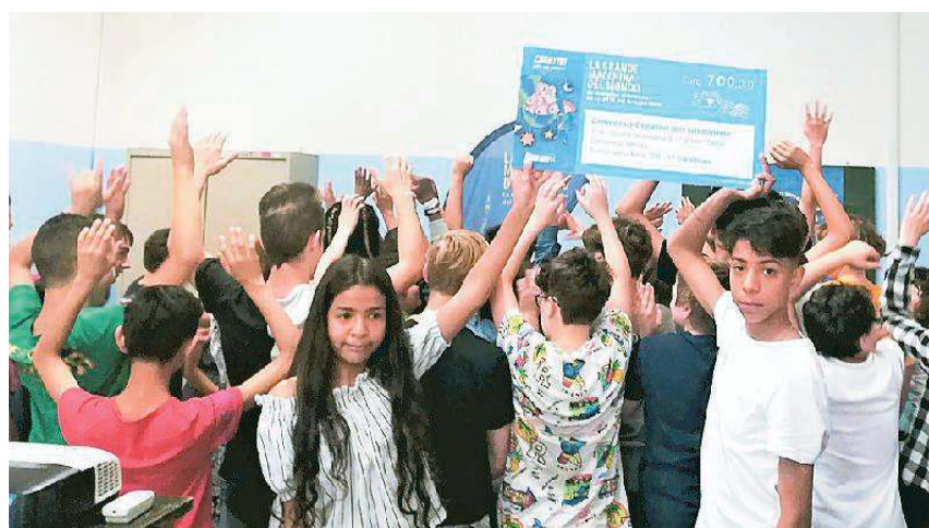
La consegna del premio agli studenti della Tasso

Tra le 81 foto ricevute dalle secondarie di I grado, la 3 a A della scuola media Torquato Tasso di Ferrara si è aggiudicata il primo posto con "L'aria pulita ti salva la vita", un manifesto dipinto ad acquerello in cui appaiono i maggiori monumenti della Terra in un'atmosfera sognante e protettiva.