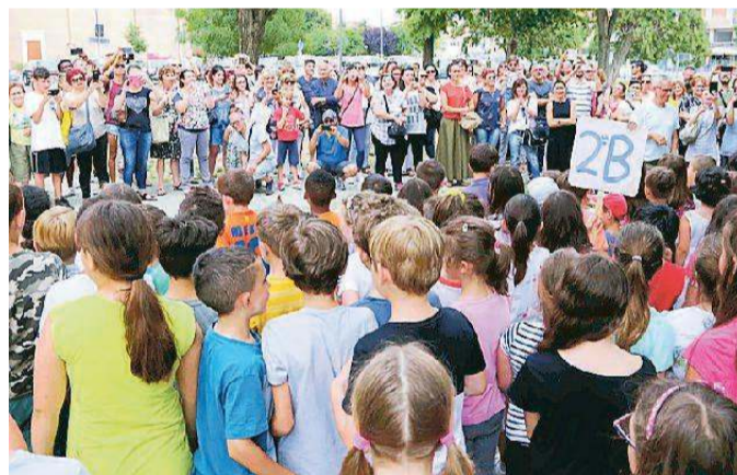
L'inaugurazione di "Siepilandia" alle scuole Mosti

Tutti i bambini delle 9 classi presenti al Mosti hanno collaborato al progetto che rappresenta per loro "un giardino fantastico" senza inquinamento e dove giocare meglio all'aria aperta. Le piantine per la siepe sono state donate da Orto condiviso mentre grazie al contributo di 600 euro ottenuto vincendo il bando del Comune di Ferrara "Scuole come beni comuni" sono stati acquistati un tavolo per l'aula didattica all'aperto; infine i genitori preziosi collaboratori hanno