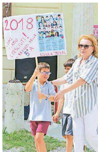
Un momento della festa

Inaugurato "Siepilandia", un progetto per riqualificare l'esterno