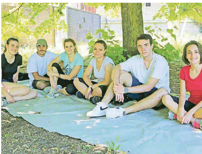
A sinistra la vegetazione selvaggia del giardino di palazzo Prospero. In alto gli studenti dell'Ariosto che hanno lavorato al recupero dell'area