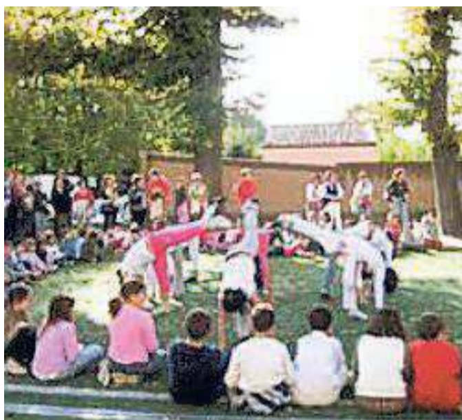
Un momento di festa alle scuole elementari Manzoni