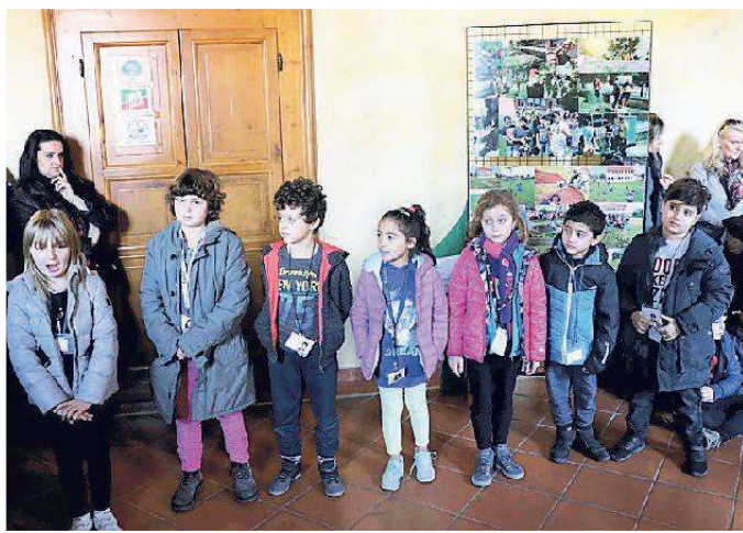
Alcuni dei bambini che hanno partecipato all'inaugurazione della mostra

Come ogni anno il Comune di Ferrara celebra la Giornata nazionale degli alberi, oggi, con l'iniziativa organizzata dal Centro Idea "Un albero per ridurre la CO2", che prevede la distribuzione gratuita di alberi e arbusti alla cittadinanza. Le piantine saranno a disposizione di tutti gli interessati dalle 9.30 alle 16 alla Palazzina dei Bagni Ducali in viale Alfonso I d'Este 17 a Ferrara.