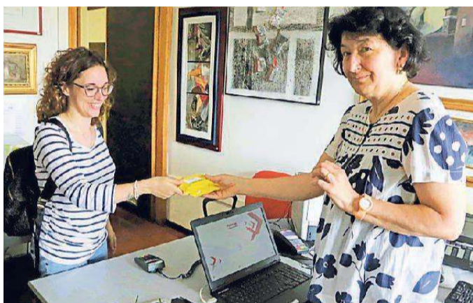
La consegna dei telepass ieri alla delegazione Nord di Pontelagoscuro

Lavori per installare la passerella ciclopedonale per gli utenti del traghetto Da lunedì scatta il cantieramento con la circolazione a senso unico alternato