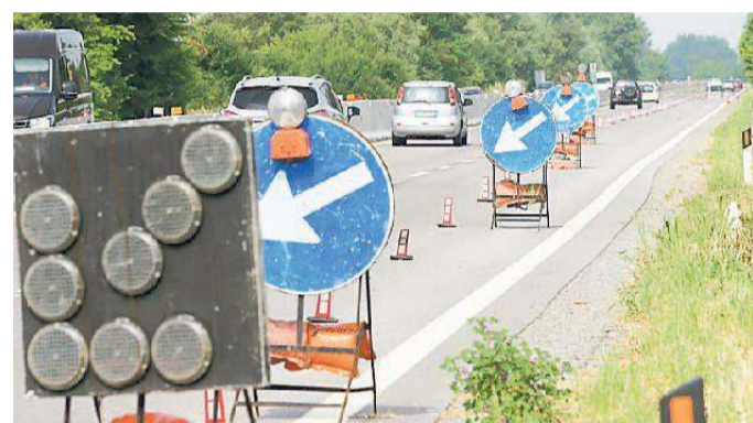
La carreggiata all'altezza di Gualdo

Intanto continuano i lavori per sistemare la rampa di accesso al traghetto fluviale che dall'11 giugno dovrà collegare le due sponde. Una rampa per rendere accessibile il transito non solo ai pedoni che potranno usare anche la scaletta metallica, ma soprattutto ai ciclisti che usufruiranno del traghetto per raggiungere Santa Maria Maddalena da Pontelagoscuro e viceversa.