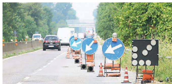
Restringimento a Masi San Giacomo

La Ferrara-mare preoccupa. In vista del primo weekend d'estate, con la festa del 2 giugno, non solo i lavori non sono cominciati ma resta chiusa una corsia in due punti in direzione Ferrara esattamente a Masi San Giacomo e Gualdo.