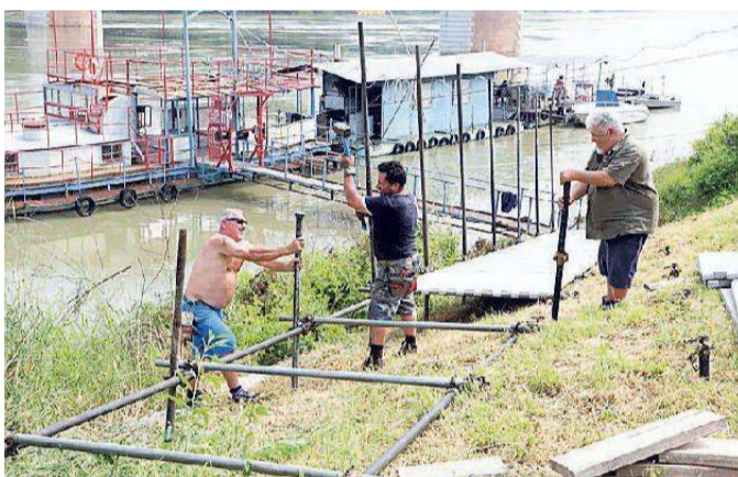
L'allestimento della passerella ciclo-pedonale a Pontelagoscuro

Le persone aventi diritto potranno usufruire del beneficio dell'esenzione solo durante il periodo di totale interruzione della viabilità e se il transito sarà convalidato con il mezzo di pagamento differito Telepass in vigenza di un contratto Tele-