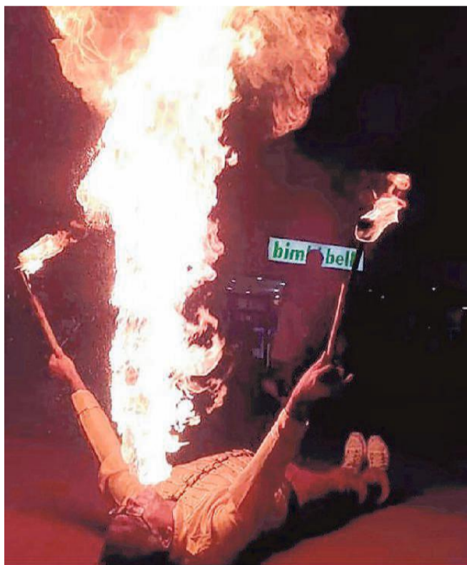
Uno degli artisti di strada che si è esibito a Portomaggiore nell'ambito dell'Antica Fiera

Dalle 21 si concluderà la prima edizione di "Artisti tra noi", festa dell'arte in piazza. Protagonisti saranno