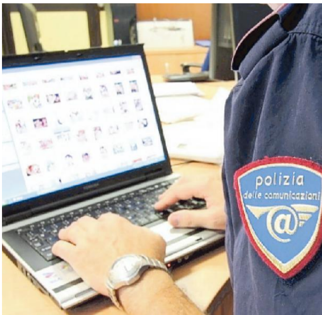
La polizia postale e delle comunicazioni indaga sulle truffe sul web

Al termine delle indagini, gli agenti della Polizia Postale sono riusciti ad accertare l'identità dell'autrice